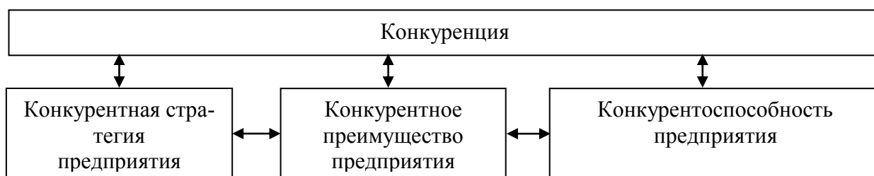
Рис. 1. Система взаимосвязанных категорий конкурентных отношений.

Анализ таких категорий, как «конкуренция», «конкурентоспособность», «конкурентная стратегия», в совокупности с конкурентным преимуществом позволит выявить нам место этого понятия и сущность в системе данных категорий. Огромное множество определений и точек зрения вышеуказанных понятий объясняется тем, что все они могут рассматриваться на различных уровнях. Категории «конкуренция», «конкурентоспособность предприятия», «конкурентное преимущество предприятия», «конкурентная стратегия предприятия» образуют целостную систему. Все эти элементы тесно взаимосвязаны и имеют место при вступлении предприятия в конкурентные отношения с другими организациями на определенном сегменте или рынке. Система взаимосвязанных категорий изображена на рисунке 1.