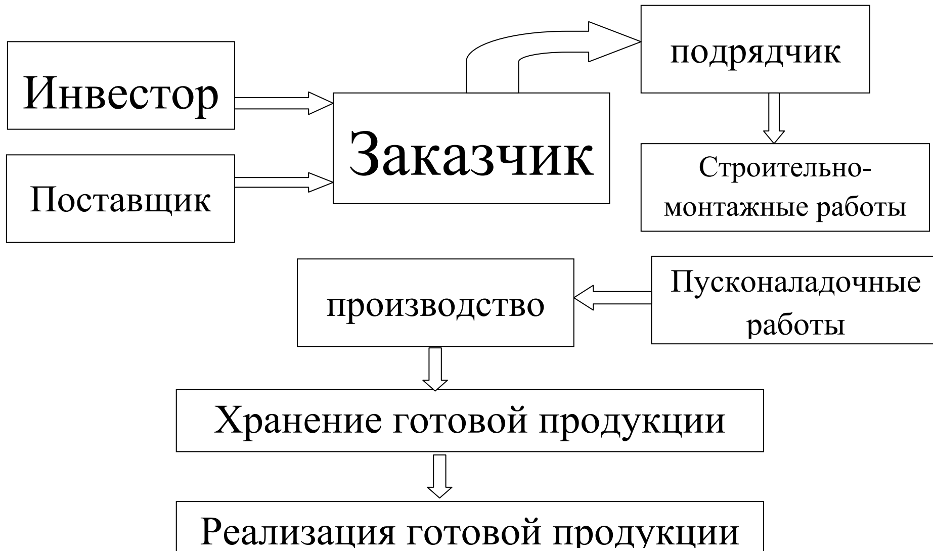
Рисунок 1 -Схема реализации процесса модернизации производства.