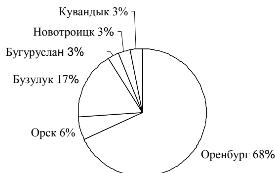
Рисунок 2 – Распределение предприятий 1С: Франчайзи в Оренбургской области

Данная практика применима как городу Оренбургу так и Оренбургской области (рисунок 1).